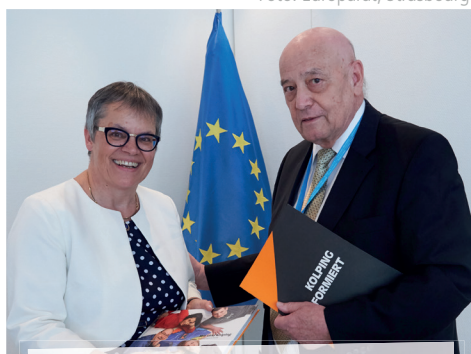
Präsidentin d. Europarates u. Schweizer Ständerätin Frau Liliane MAURY PASQUIER (li) im Gespräch mit dem Europabeauftragten des Int. Kolpingwerkes Reg. Rat Anton SALESNY

Beeindruckt sei sie von der umfangreichen europäischen Bildungs- und Informationsarbeit, welche im Rahmen des Kolpingwerkes einen hohen Stellenwert habe.